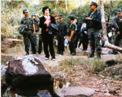
๒๔ ธันวาคม ๒๕๒๕ ทรงปลูก ต้นไม้ที่บ้านทรายทอง ตำบลโคกสี อำเภอสว่างแดนดิน จังหวัด สกลนคร