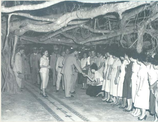
สภาพของป่าเมื่อปีพุทธศักราช ๒๕๐๖