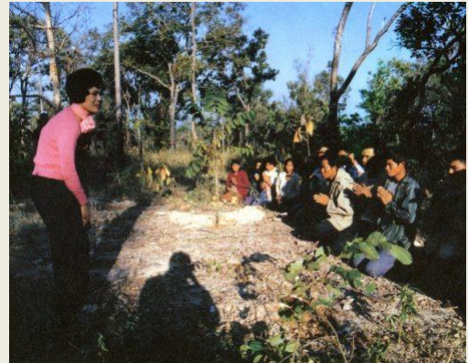
มีพระราชปฏิสันถารกับราษฎร ที่ปลูกป่าถวาย