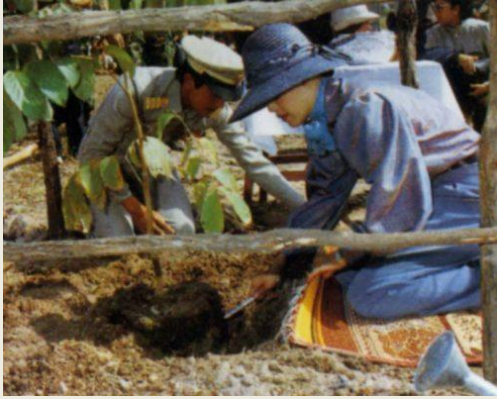
๒๔ ธันวาคม ๒๕๒๕ ทรงปลูก ต้นไม้ที่บ้านทรายทอง ตำบลโคก สี อำเภอสว่างแดนดิน จังหวัด สกลนคร