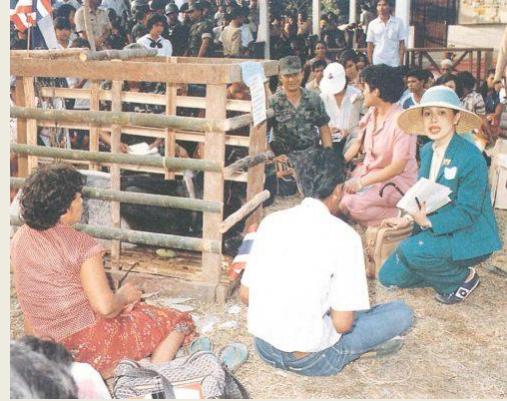
๑ กันยายน ๒๕๒๖ เสด็จฯ ไป บ้านโตะโมะ ตำบลภูเขาทอง กิ่งอำเภอสุคีริน จังหวัดนราธิวาส